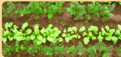
Les radis plantés entre les rangs de carottes